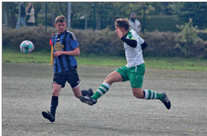
Heimspiel gegen Otterwisch